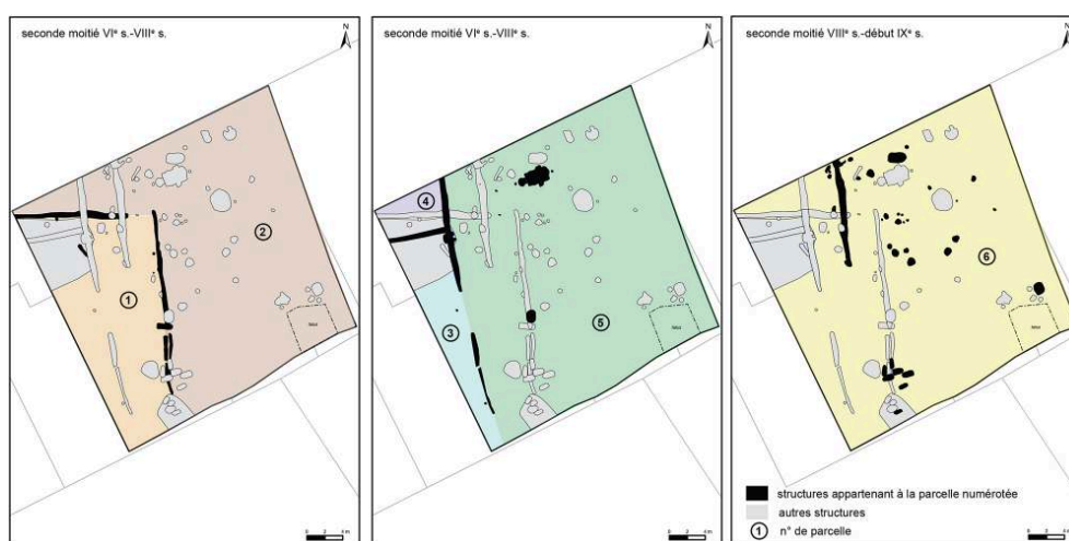
Fig. 1 – Plan des parcelles

morphologie de l'habitat à cette période. Dans l'état actuel des connaissances, nous ignorons les modalités de l'organisation et l'évolution de cette bourgade. Est-elle comparable à une structure en plusieurs pôles, par exemple, ou existe-t-il déjà un noyau central constitué dès les VI e -IX e s. ? La configuration d'un éventuel bourg au haut Moyen Âge et son lien avec l'habitat de la rue du Château, ainsi que les relations entre ce dernier et les autres indices alto-médiévaux mis au jour dans la commune, sont pour l'instant difficiles à appréhender. Seules des recherches plus poussées à l'échelle du bourg et de la commune permettraient d'apporter, le cas échéant, des éléments de réponses.