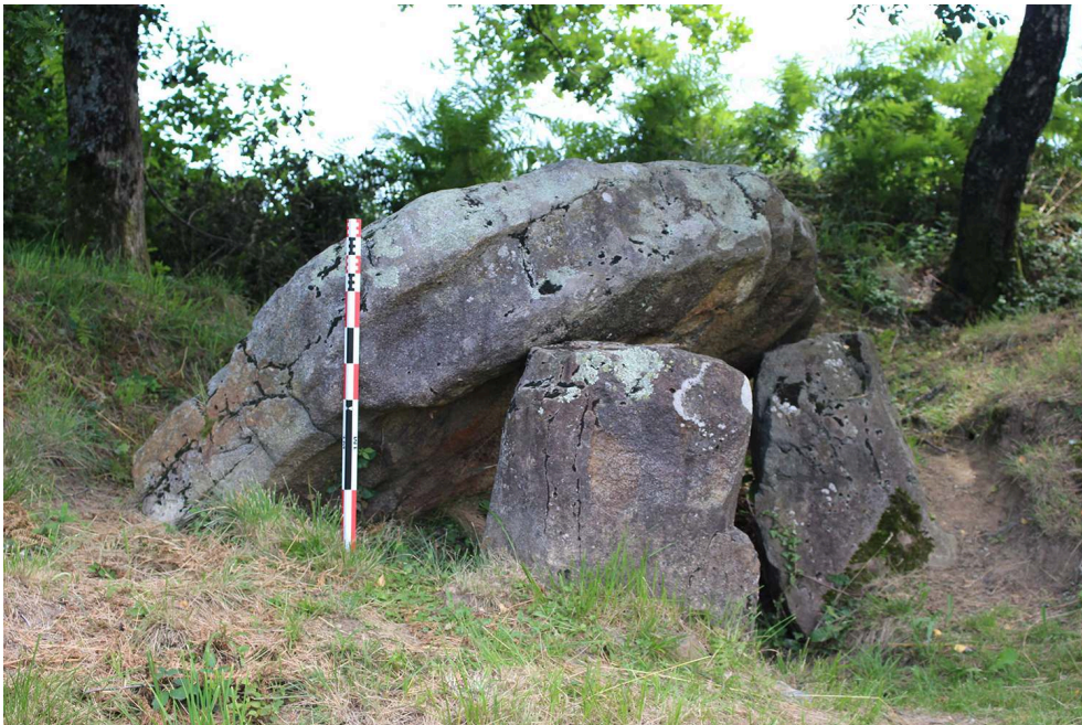
Fig. 1 – Dolmen de Peyre Dusets à Loubajac (Hautes-Pyrénées)