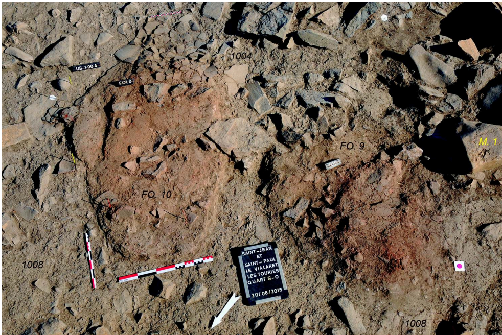
Fig. 3 – Vue d'ensemble des foyers sur sole d'argile FO. 9 et FO. 10 mis au jour en 2015