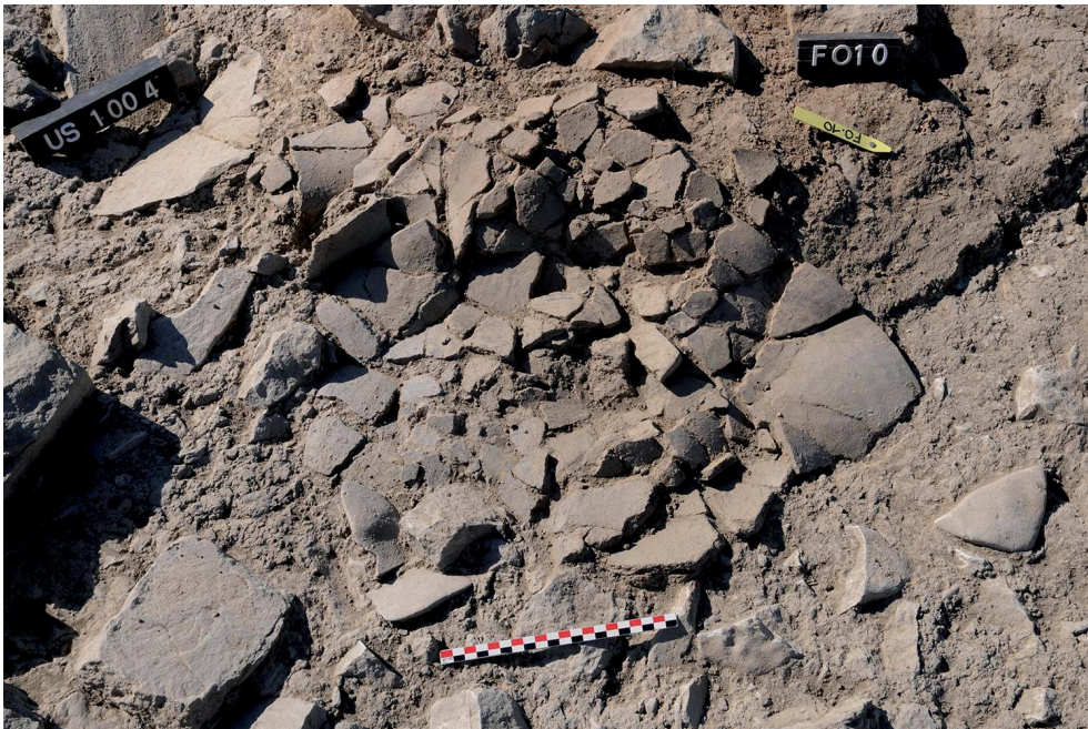
Fig. 4 – Détail du dépôt de vases mis au jour sur la bordure méridionale du foyer FO. 10