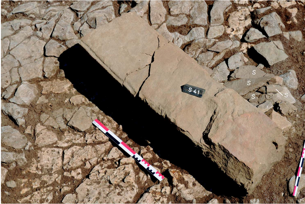
Fig. 2 – Vue de la stèle 41 couchée sur l'u.s. 1039 avec des fragments d'autres stèles (S)