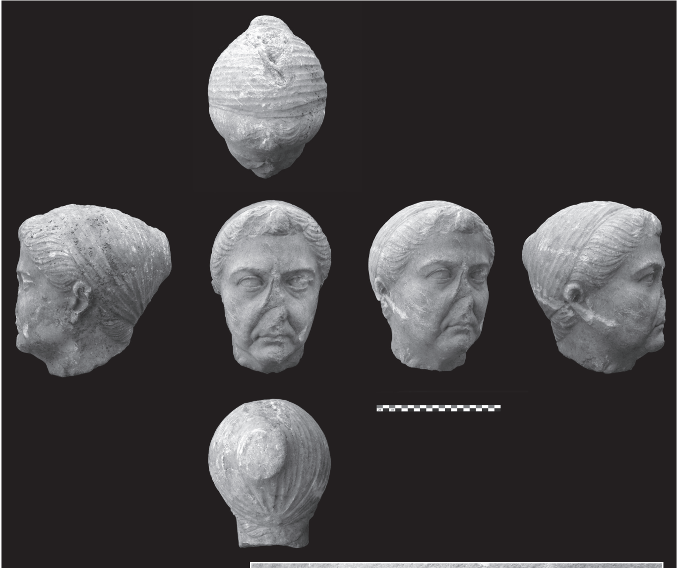
Photos du portrait de Sercy.