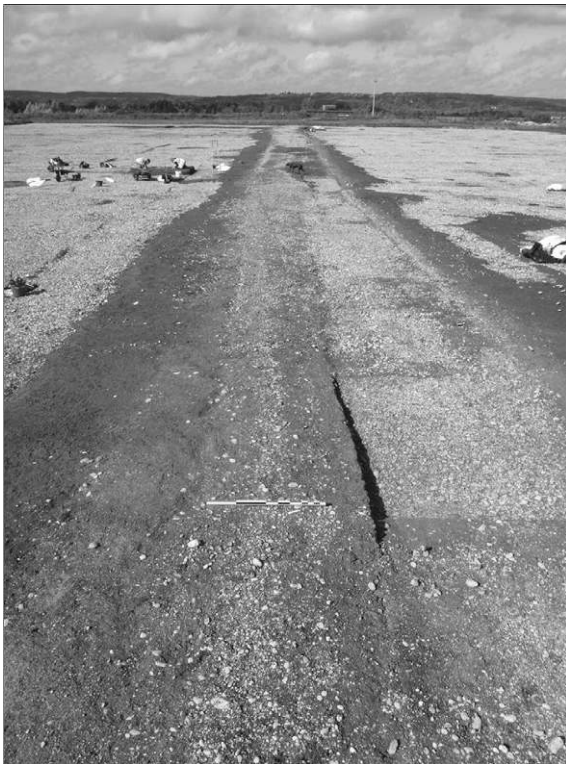
Fig. 2 – Vue de la voie vers l'ouest