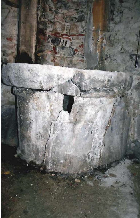
Fig. 4 – Margelle du puits de la cour intérieure