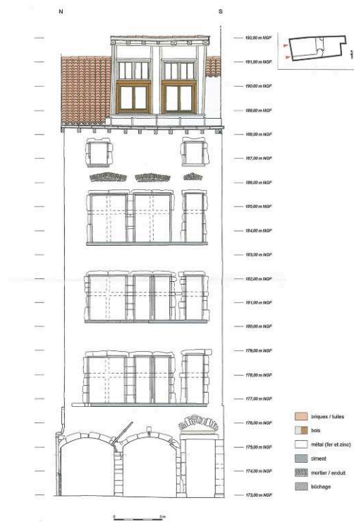
Fig. 2 – Relevé d'élévation du mur de façade sur rue