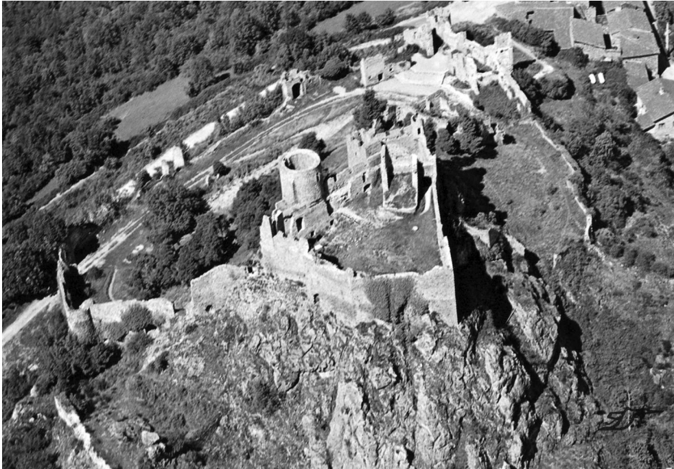
Fig. 1 – Vue générale