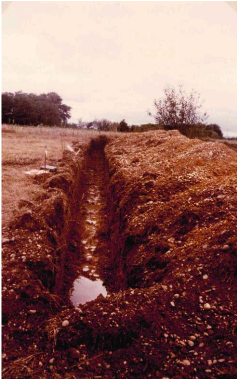
Fig. 1 – La tranchée 2, en limite de parcelle 191