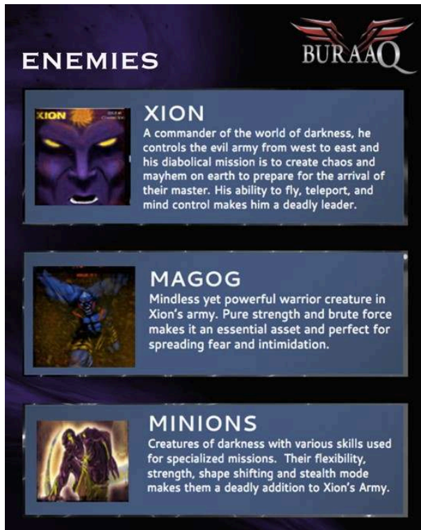
Figure 1 – Buraaq

mortelle. Ici aussi la métaphore est très claire : les Minions, dans le monde réel, peuvent être interprétés comme le Mossad, le service secret israélien, alors que Magog correspond en taille et en puissance aux États-Unis, un allié indispensable pour Israël.