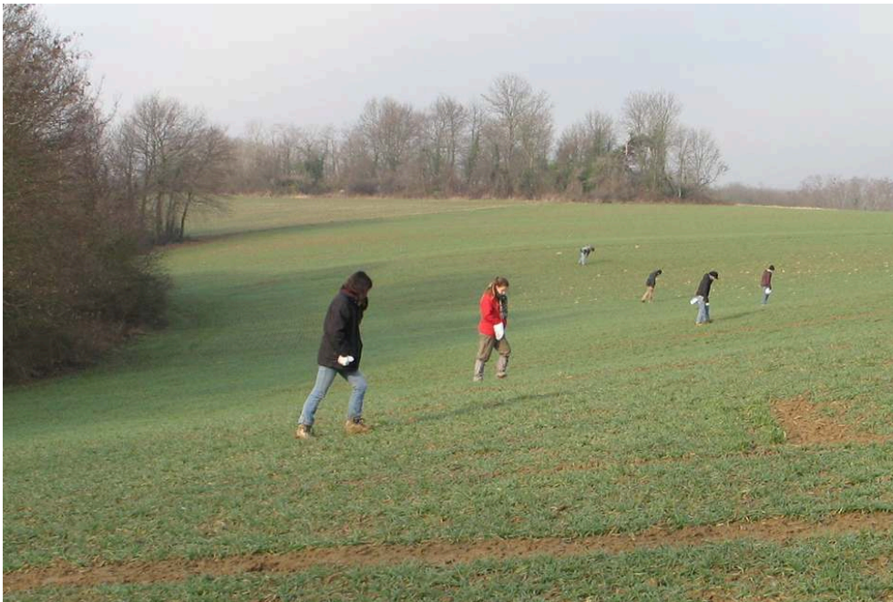
Fig. 2 – Prospection systématique en cours sur la terrasse de Tourdan (février 2006)