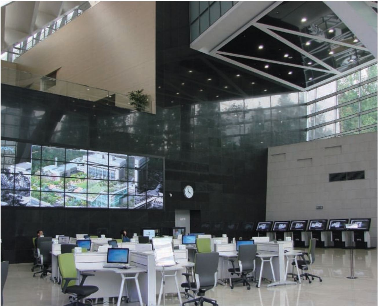
La Bibliothèque nationale de Corée : à l'image de la bibliothèque scientifique de demain ?