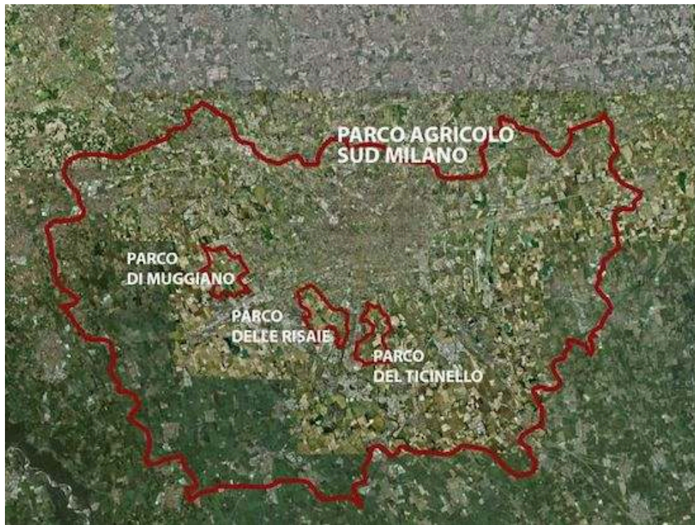
Figure 2. Le parc agricole Sud de Milan et l'emplacement du projet de parcs agricoles locaux à l'intérieur