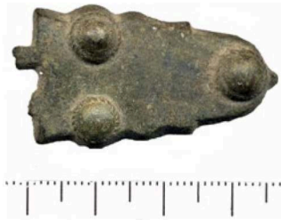
Fig. 7 – Plaque de boucle de ceinture mérovingienne