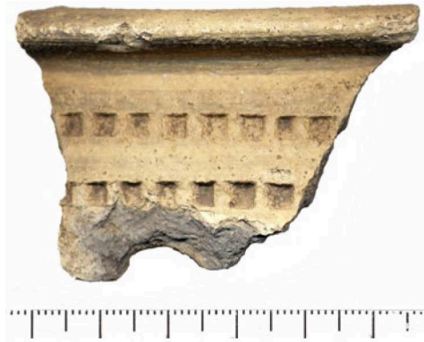
Fig. 5 – Céramique carolingienne