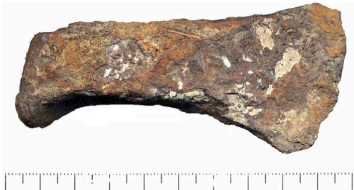
Fig. 4 – Petite francisque en fer