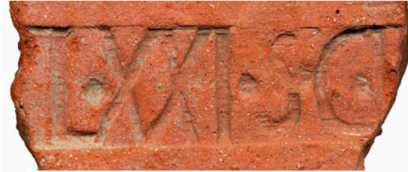
Fig. 3 – Tuile estampillée au nom de la legio XXI sur Altkirch