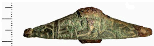
Fig. 6 – Pommeau de spatha au décor mérovingien