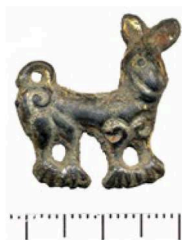
Fig. 8 – Fibule zoomorphe en bronze doré décorée de trois perles en verre bleu