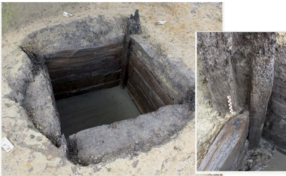
Fig. 5 – Puits 74 à cuvelage en chêne dont l'assemblage est réalisé à l'aide de rainures verticales sur deux faces des pieux quadrangulaires dans lesquelles sont insérées les planches dont les extrémités sont amincies

Date d'abattage des pieux : 194 av. J.-C.