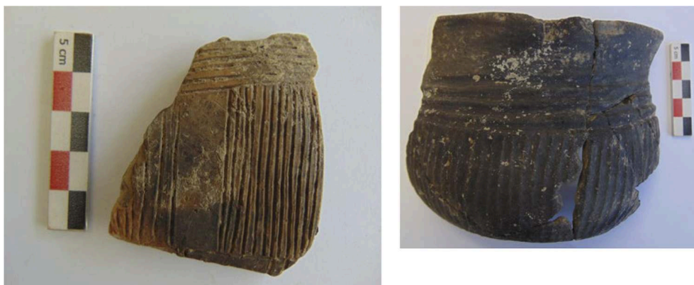
Fig. 3 – 1, tesson décoré d'incisions en panneaux verticaux et de séries d'incisions horizontales de la fin du Bronze moyen issue de la STR 601 (Bz C) ; 2, céramique à cannelures légères couvrantes de tout début du Bronze final provenant de la STR 573 (Bz C2-D1)

Levées topographiques : J.-L. Wüttmann ; DAO : C. Véber (Inrap).