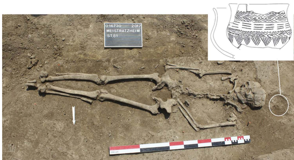
Fig. 1 – Sépulture 81 datée de l'horizon Planig-Friedberg (entre 4680-4640/4585-4570 av. J.-C.) et la céramique qui a été déposée derrière la tête