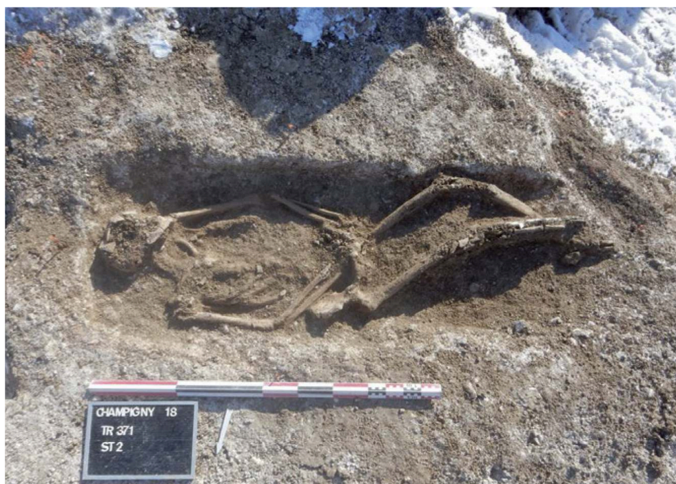
Fig. 1 – Vue d'ensemble de la sépulture antique St. 2