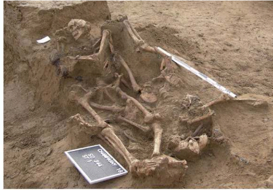
Fig. 3 – St. 1, agencement des trois soldats allemands dans une sépulture d'urgence