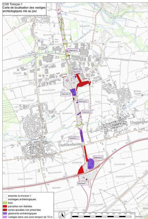
Fig. 1 – Localisation des gisements archéologiques