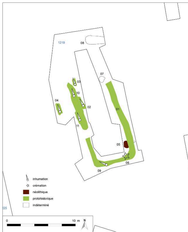
Fig. 2 – Plan du Langgraben (sd 1219)