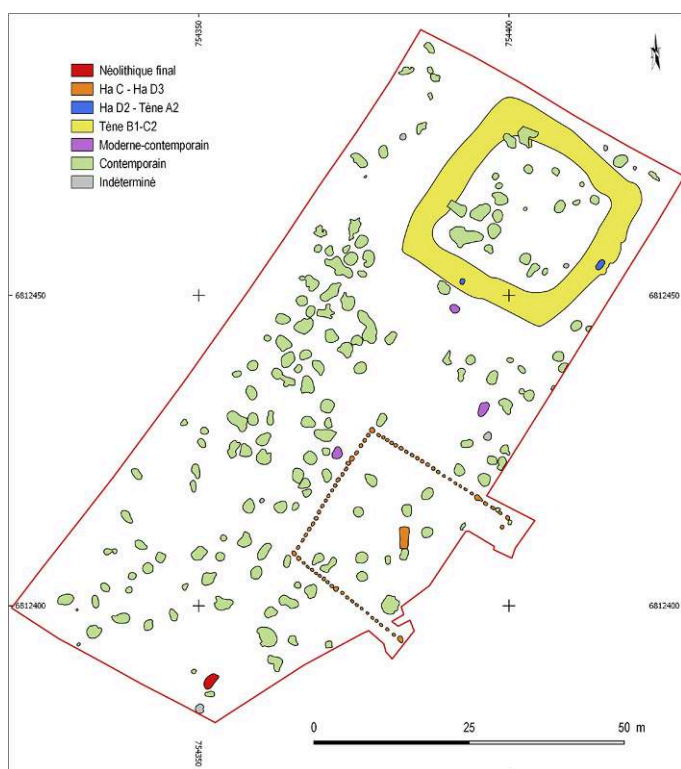
Fig. 1 – Plan général phasé du site