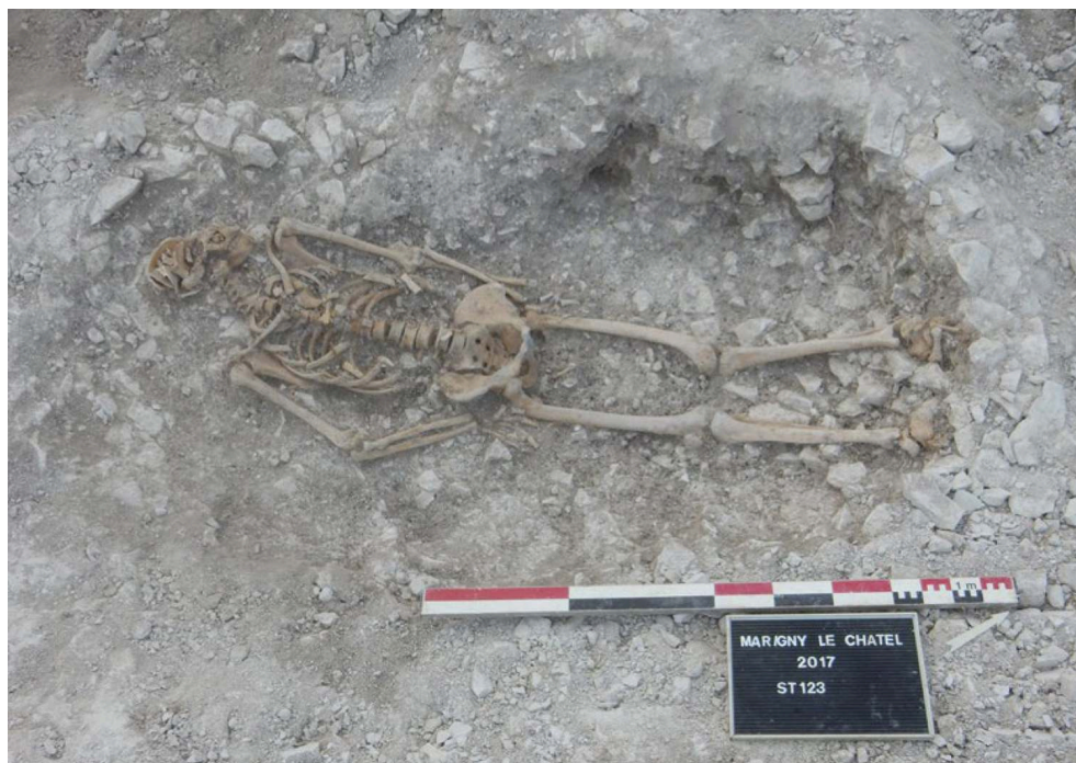
Fig. 2 – Sépulture 123