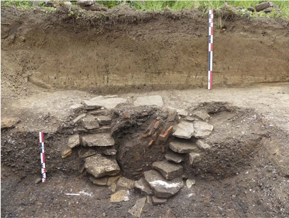
Fig. 2 – Puits