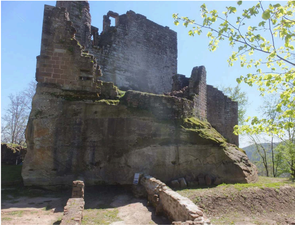
Fig. 2 – Rocher portant le bastion nord en avril 2019