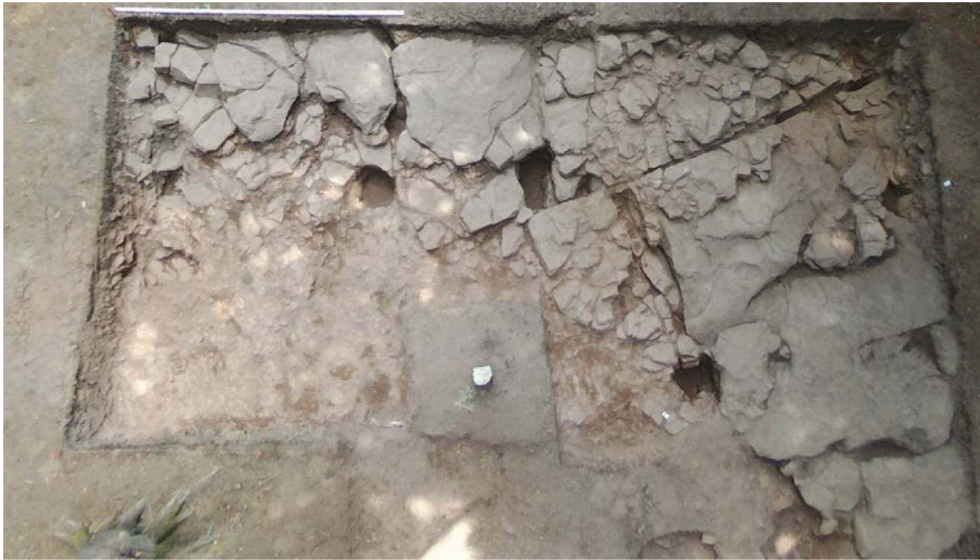
Fig. 1 – Le bâtiment 1