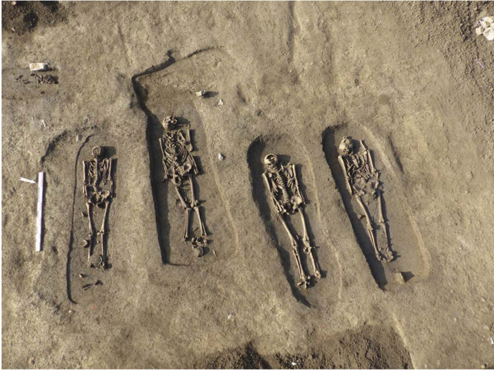
Fig. 1 – Ensemble funéraire en cours de fouille