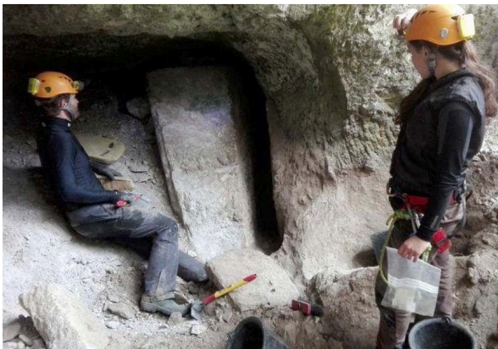
Fig. 2 – Dégagement d'un sarcophage non détaché au Sarcoui