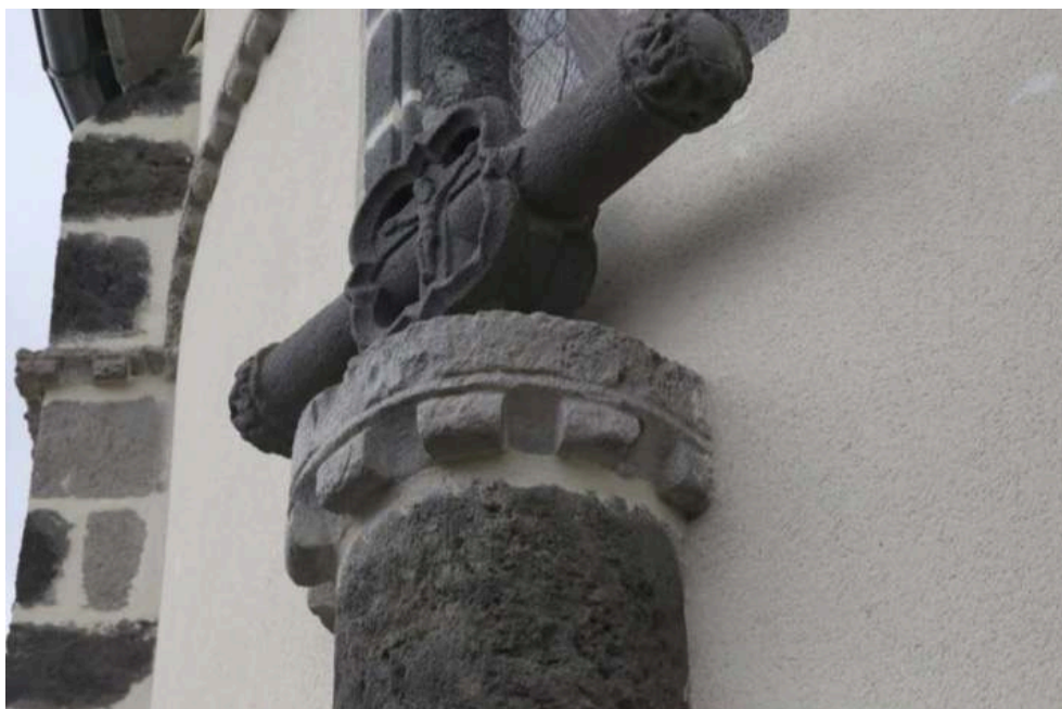
Fig. 3 – Couronne denticulée en trachyte sur un calvaire adossé à l'église de Gelles