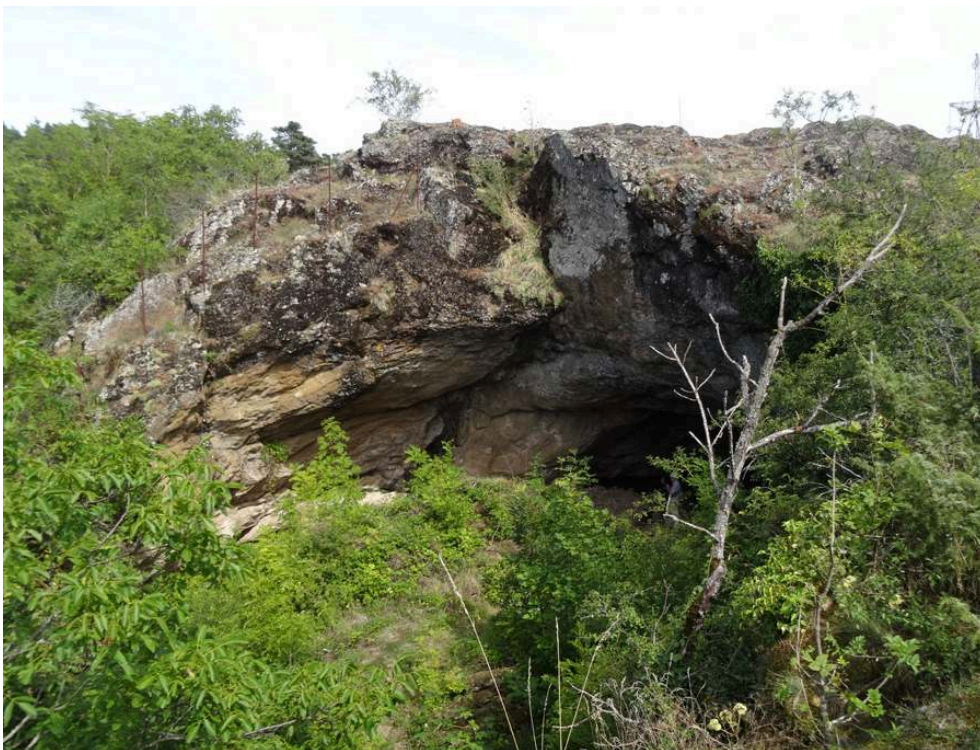
Fig. 1 – Vue générale du site