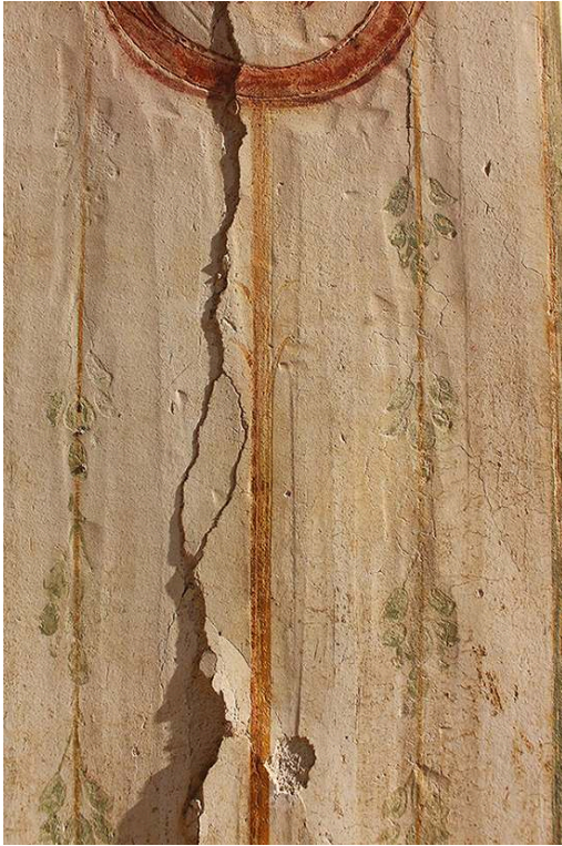
Fig. 12. Casa del Principe di Napoli (VI 15, 7-8), détail du piedroit extérieur est de l'exèdre m, donnant sur le portique I.