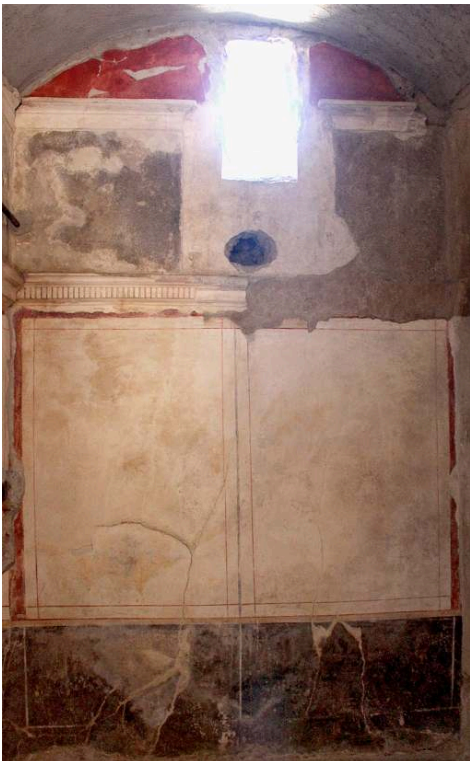
Fig. 3. Casa del Principe di Napoli (VI 15, 7-8), paroi est du cubiculum c.