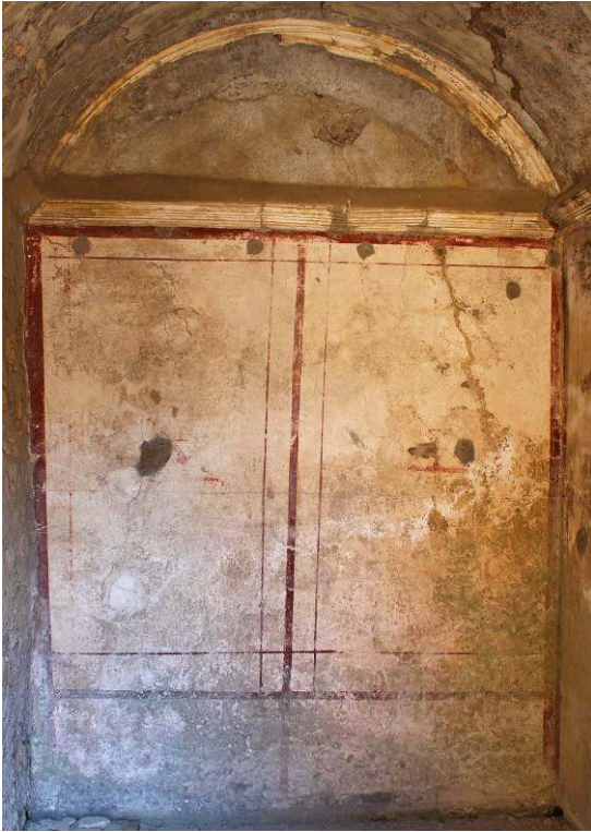
Fig. 02. Casa di Meleagro (VI 9, 2-13), paroi sud du cubiculum 46.