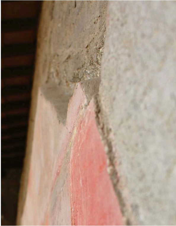
Fig. 8. Casa del Menandro (I 10, 8), paroi est du péristyle, détail de l'angle dit en sifflet en haut de la zone principale.