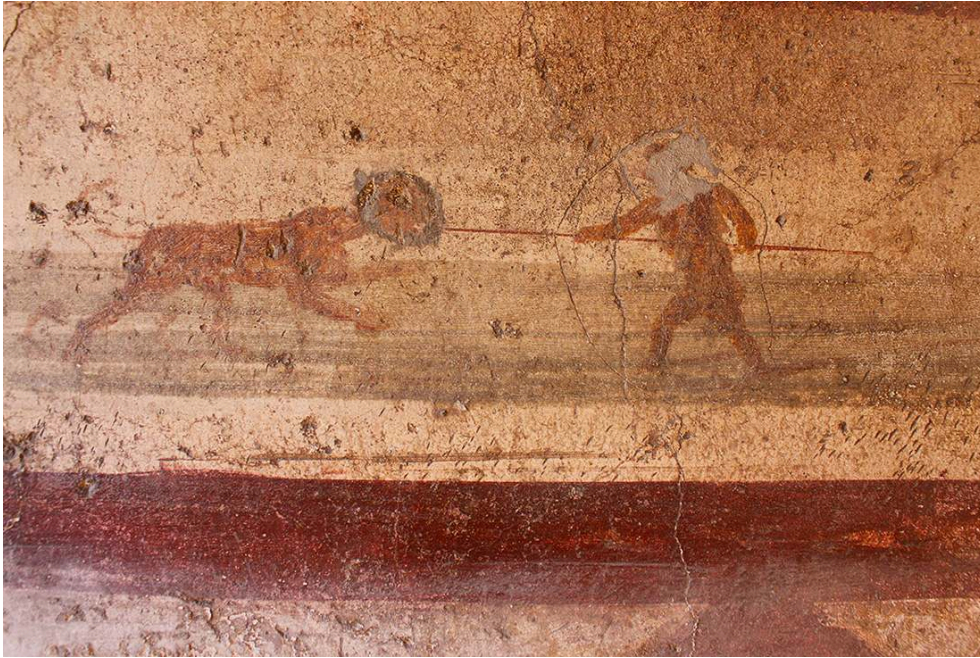
Fig. 5. Caupona della via di Mercurio (VI 10, 1), paroi sud de la pièce d, détail des traces d'ongles sous les personnages de la prédelle.