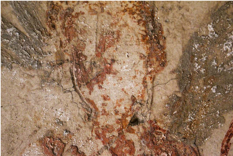
Fig. 6. Caupona della via di Mercurio (VI 10, 1), paroi sud de la pièce d, détail du tracé incisé dans le visage de l'amour situé au centre du panneau droit.