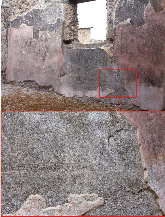
Fig. 9. Casa (VI 13, 13), paroi est du triclinium d, tracés incisés dans la couche de mortier intermédiaire.