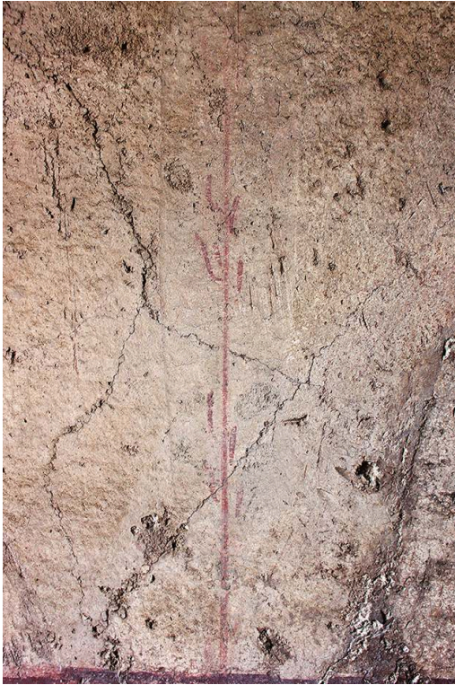
Fig. 7. Caupona della via di Mercurio (VI 10, 1), paroi sud de la pièce d, empreinte d'une règle pour le positionnement de la tige végétale.