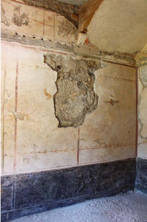
Fig. 1. Casa del Principe di Napoli (VI 15, 7-8), paroi ouest du cubiculum f.