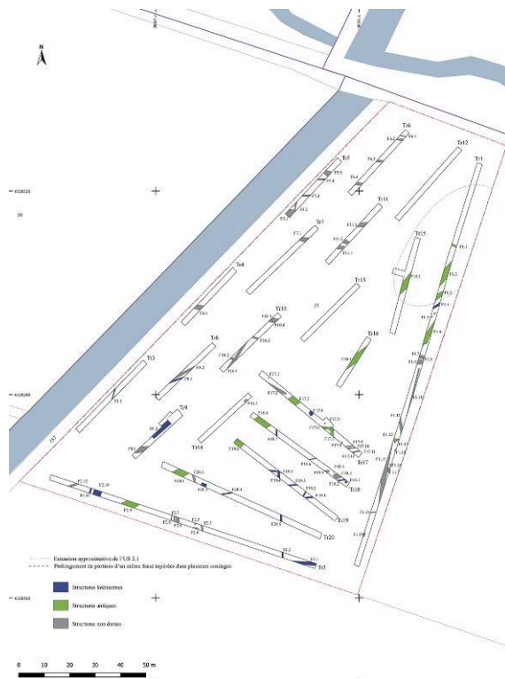
Fig. 1 – Plan phasé des structures sur un extrait du plan cadastral informatisé