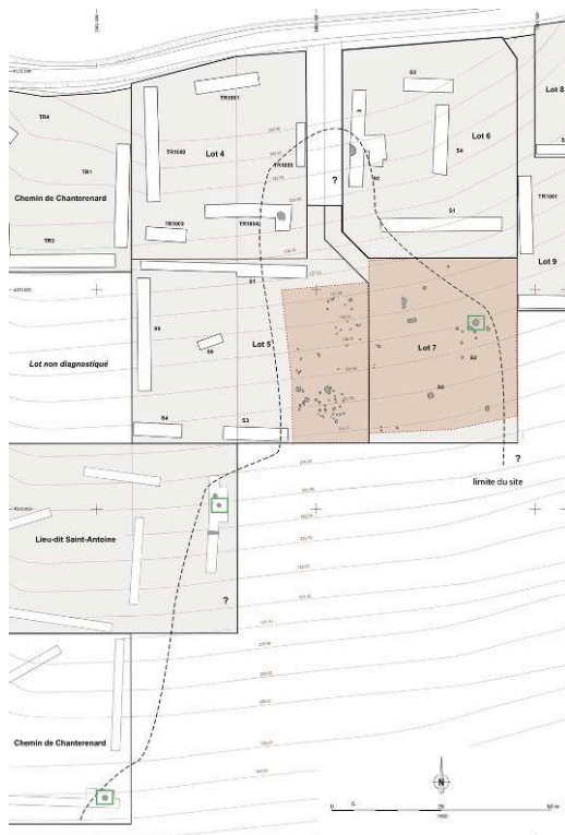
Fig. 3 – Plan cumulé des opérations réalisées dans le secteur de l'emprise du diagnostic

Les carrés verts matérialisent les structures du Bronze final.