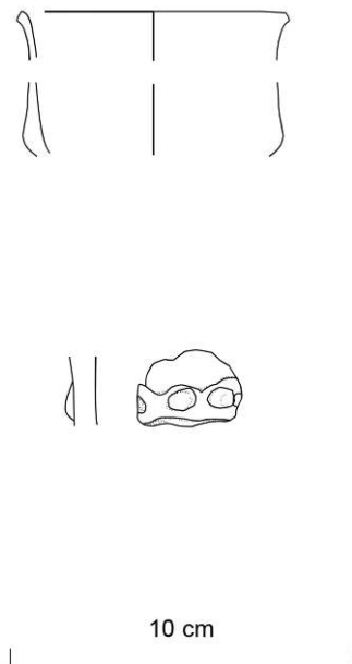
Fig. 2 – Mobilier céramique de la fosse