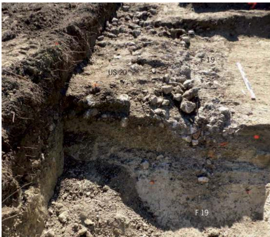
Fig. 3 – Vue générale du fossé antique F19

Vue du nord, dans le sondage 4.