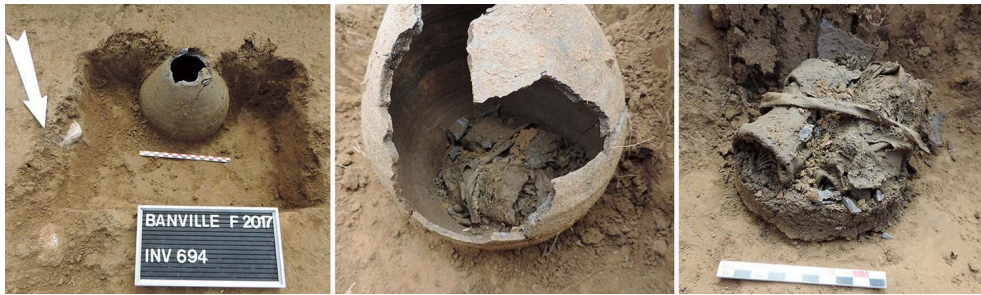
Fig. 2 – Vues de la fouille du dépôt monétaire gallo-romain