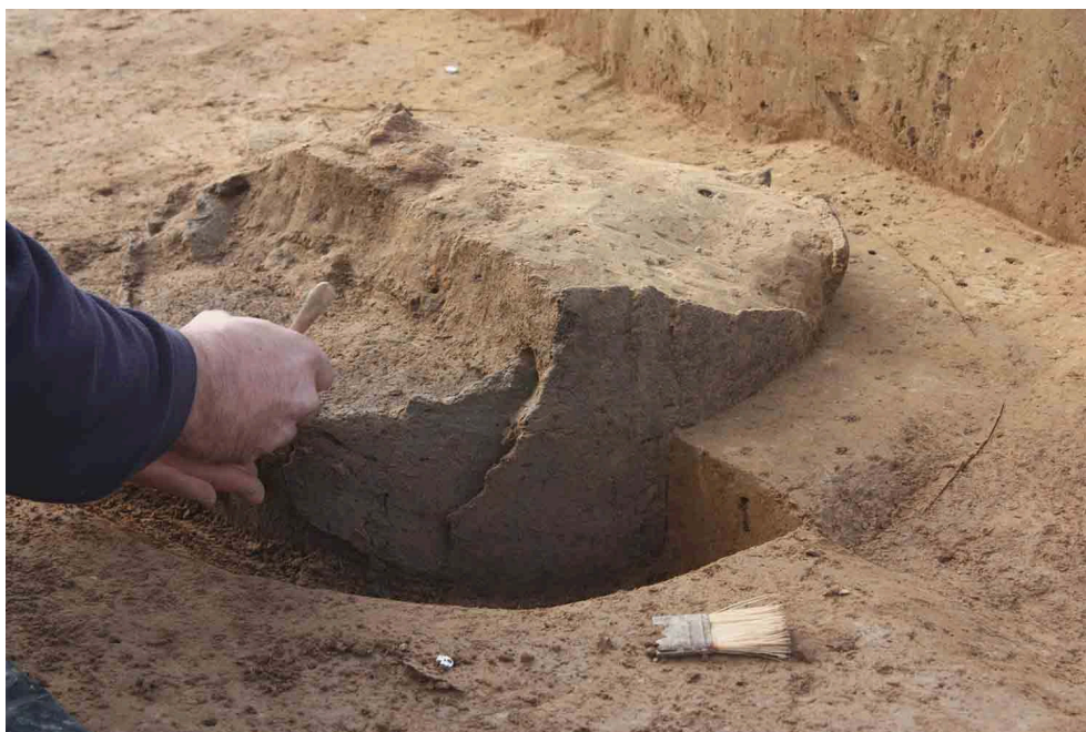
Fig. 2 – Vase-silo du Bronze final