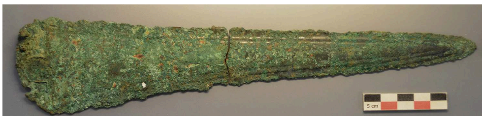
Fig. 2 – Lame de poignard de la tombe princière