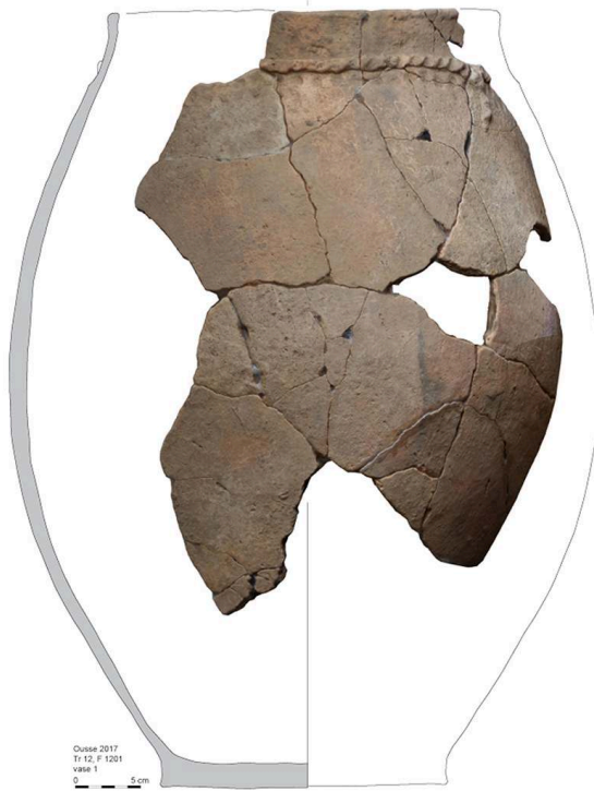
Fig. 2 – F 1201 : grande jatte ovoïde