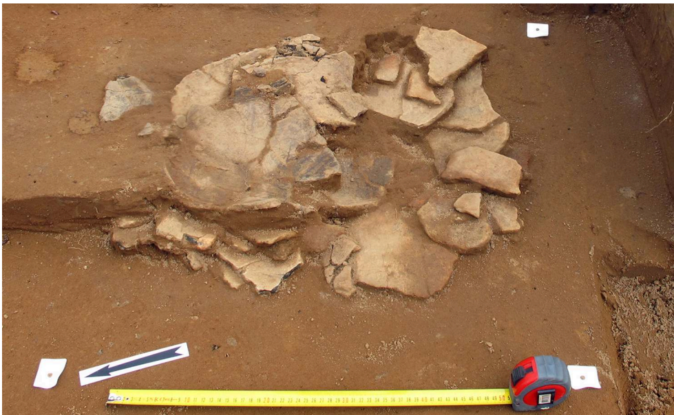
Fig. 1 – Vue d'ensemble du dépôt de céramique F 1201 dans son contexte