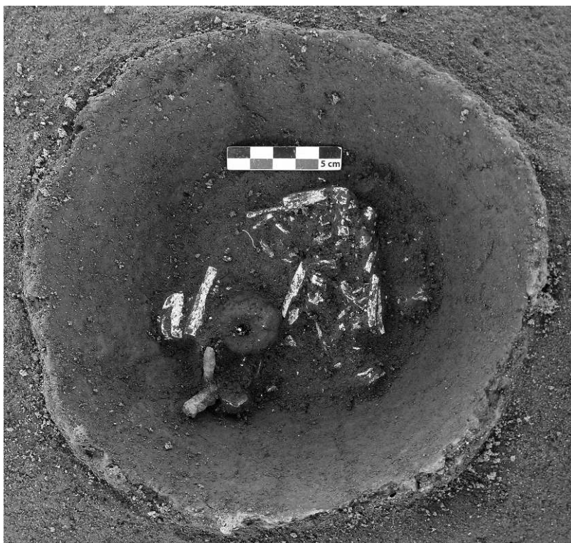
Fig. 2 – Urne SP1002 en cours de fouille : ossements crémés et fusaïole