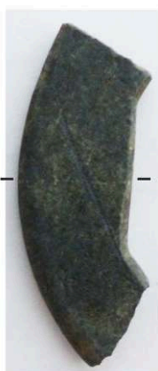
Bracelet F 2.01

Dessin et cliché : M.-H. Jamois (Inrap).