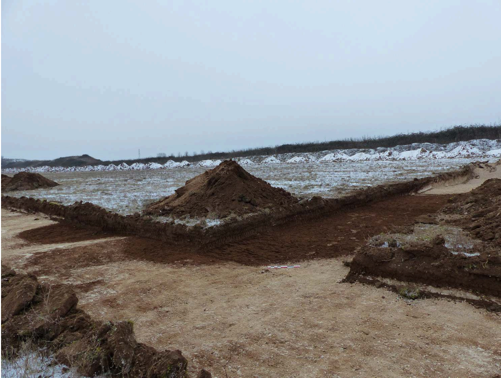
Fig. 1 – Vue prise du nord du fossé découvert en partie nord-ouest de l'emprise