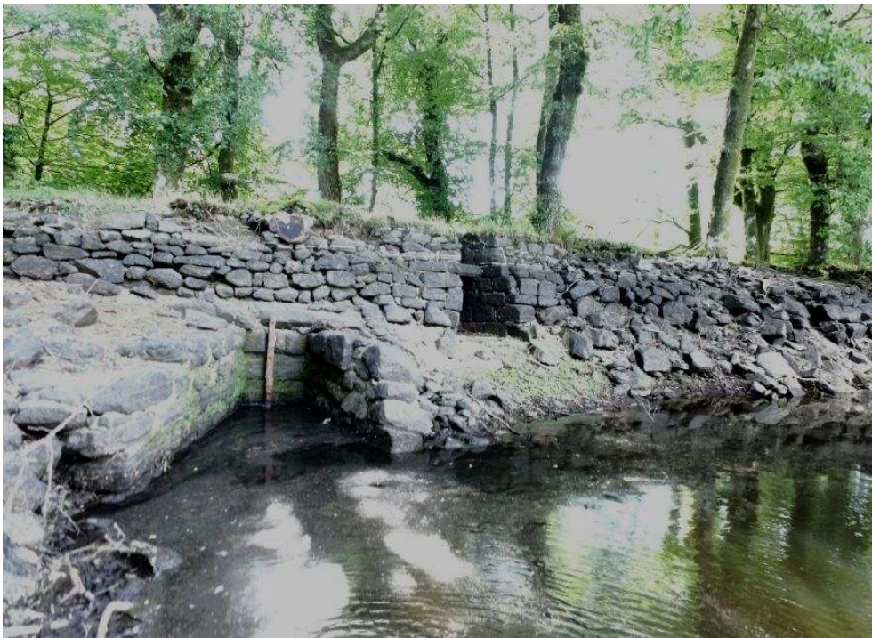
Fig. 2 – Petit étang des Chênes : vue d'une partie de la digue avec les vannes