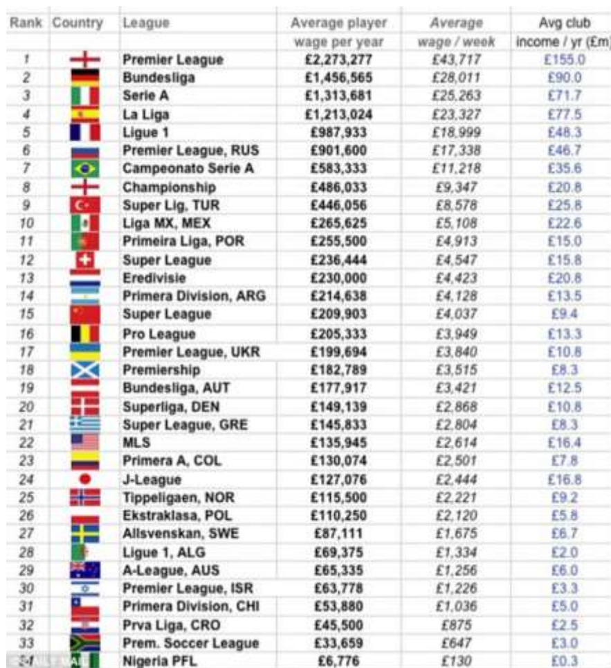
2. ábra: Átlagos játékosfizetések a világ nagyobb labdarúgó ligáiban

Annak kérdése, hogy az átigazolási díjból és kapcsolódó díjakból milyen érintettek milyen mértékben részesednek, újabb szabályozási megoldásokat hozott életre, elsősorban a sport önszabályozó testületei (FIFA, UEFA) által. Az UEFA megköveteli, hogy egy általa bevezetett standard rendszerben nyilvántartsanak minden a tagszövetségeket érintő játékostranzfert, amelynek nagyobb adatbázissá szerveződése további szabályozási finomításokra adhat majd alkalmat (KEA-CDES, 2013).