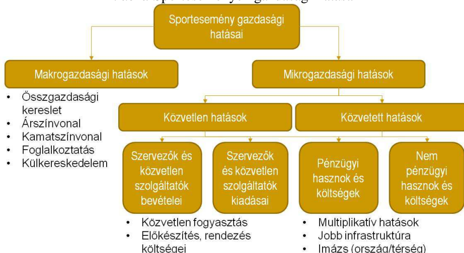
2. ábra Sportesemények gazdasági hatásai