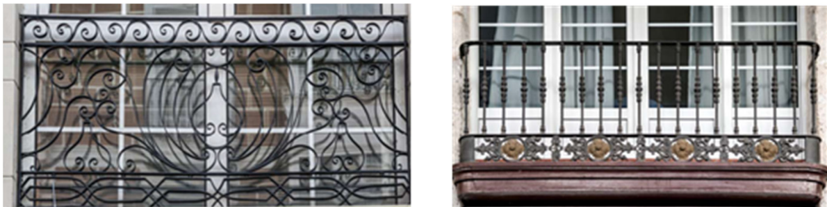
Figura 13. Balcones con rectas y curvas

Los niños y las niñas expresan sin dificultad el predominio de líneas curvas o rectas, según sean los distintos elementos urbanos y además son capaces de registrar otras más difíciles de definir porque contienen, a la vez, ambos tipos de líneas (Figura 13). Realizan clasificaciones, cuando es posible.