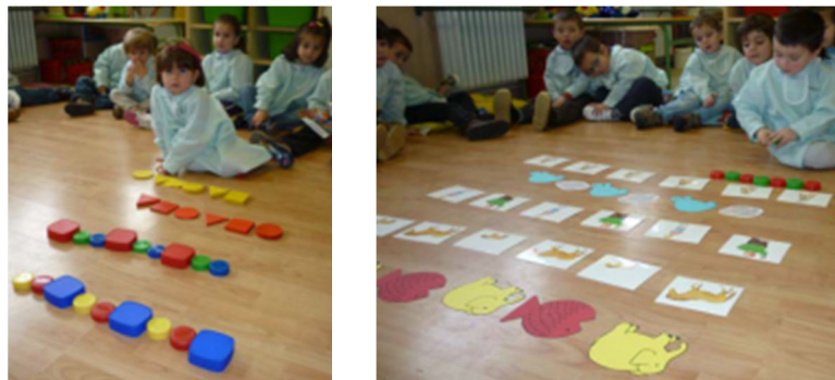
Figura 9. Seriaciones con distintos tipos de materiales

Se hacen seriaciones con material no estructurado (tapones de diversos tamaños, formas y colores) y con material estructurado (bloques lógicos, tarjetas de conceptos gráficos, formas figurativas o abstractas...) (Figura 9).