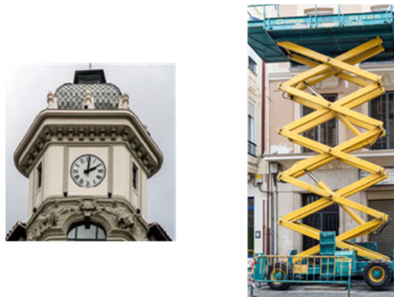
Figura 7. Otros elementos de la calle Mayor

Se experimenta con diversas fachadas y otros elementos de forma similar (Figura 7).