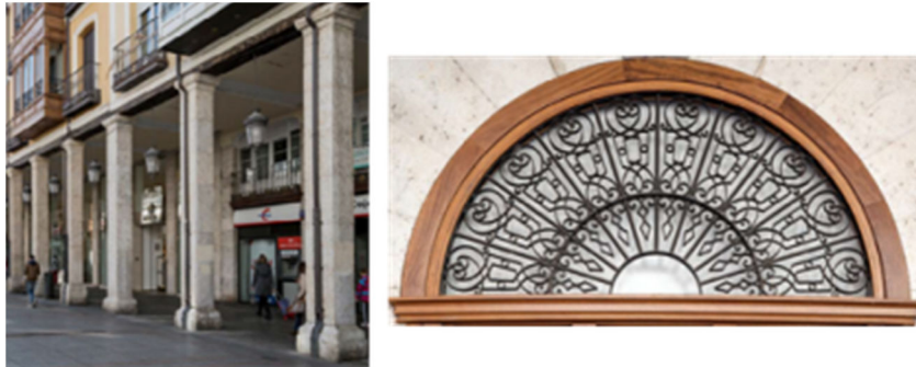
Figura 12. Columnas en la calle y parte superior de una puerta