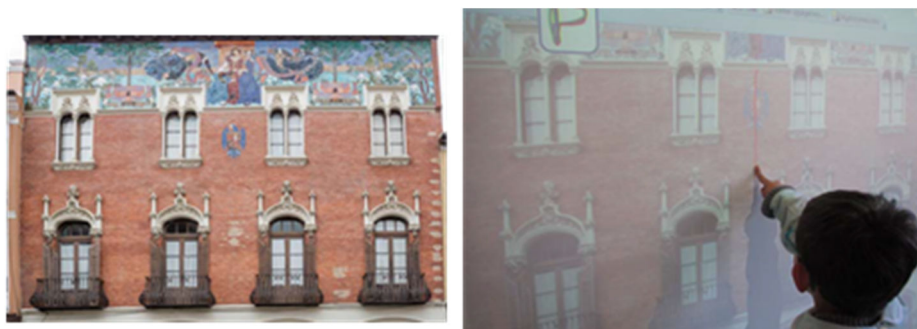
Figura 17. Después de argumentar pasamos a dibujar...

A continuación se acercan a la pizarra a dibujar el eje de simetría (Figura 17).