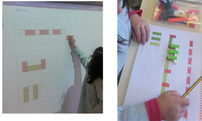
Figura 10. Seriaciones con regletas en la pizarra digital y en el papel cuadriculado

En este momento solo es preciso atender a una de las caras de los prismas y no se van a diferenciar las figuras planas y las volumétricas, porque cuando se pasen las seriaciones a papel aparecerá una proyección plana, de una de las caras.