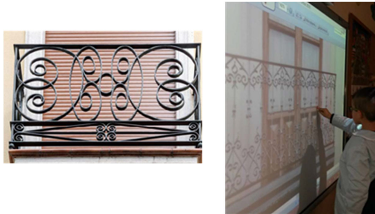
Figura 14. Descubriendo líneas rectas, curvas, abiertas y cerradas