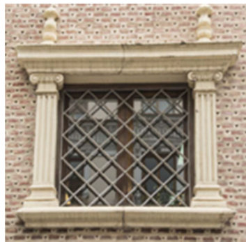
Figura 5. Ventana en fachada de la Calle Mayor

Conseguida ya cierta familiaridad con las figuras geométricas, nos enfrentamos a localizarlas en las estructuras arquitectónicas que encontramos en la Calle Mayor de la ciudad. Se van a ir intercalando los descubrimientos en la excursión con las actividades posteriores en el aula.