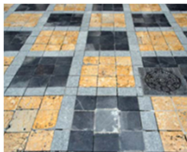
Figura 11. Series con baldosas