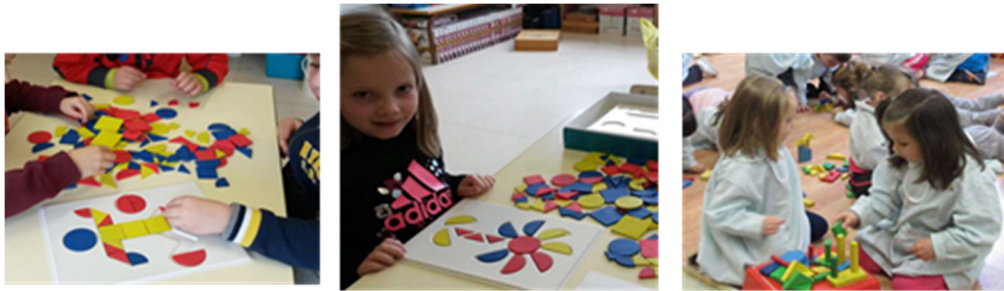
Figura 4. Actividades para manipular libres y pautadas

Conseguida ya cierta familiaridad con las figuras geométricas, nos enfrentamos a localizarlas en las estructuras arquitectónicas que encontramos en la Calle Mayor de la ciudad. Se van a ir intercalando los descubrimientos en la excursión con las actividades posteriores en el aula.