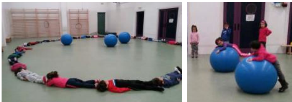
Figura 1. Circunferencia y experiencias con la esfera

Se hace un corro grande, con intención de delimitar un círculo, formando con los cuerpos su borde (Figura 1), y se recuerda que se llama circunferencia. Se percibe que el círculo es plano. Y se contraponen al espacio que ocupan unos balones grandes de forma esférica. Se interioriza su volumen, realizando elevaciones sobre ellos y deslizándose por sus superficies curvas.