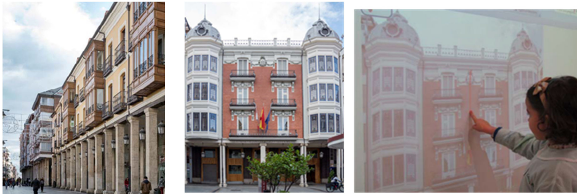
Figura 16. Dibujando el eje de simetría