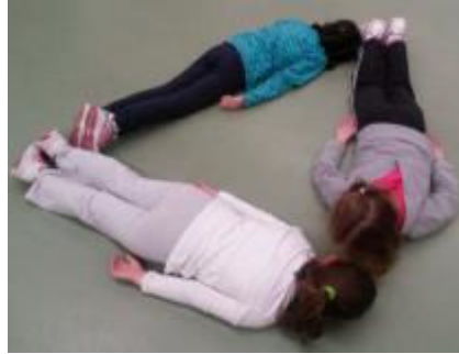
Figura 2. Construcción de triángulos con el cuerpo

Cuando se hace la propuesta de agruparse de cuatro en cuatro para formar cuadrados, se agrupan de nuevo como quieren, pero esta vez la maestra actúa: