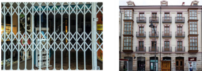
Figura 8. Rombos, cuadrados y rectángulos en la calle

Como en el caso de la ventana, se marcan los rombos de distintos tamaños en el entramado metálico (Figura 8). Y, en cada caso, se comparan con una lana sus diagonales, argumentando, una vez más, que no miden lo mismo.