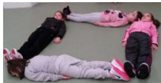
Figura 3. Reagrupaciones atendiendo a la altura y construcción de cuadrados con el cuerpo

A la hora de plantear cómo hacer rectángulos la maestra vuelve a actuar: