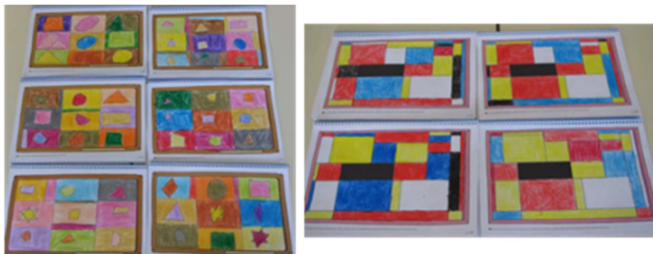
Figura 19. Embaldosados diseñadas en el aula

Finalmente son ellos los que componen un cuadro estético a partir de figuras geométricas (Figura 19). Podría ser un embaldosado... o una decoración para una fachada... En cualquier caso se trata de considerar la belleza de las formas geométricas.