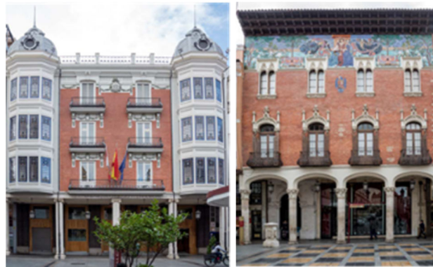
Figura 18. Primer y segundo edificio elegidos

Se van nombrando todos los colores que aparecen y todos están de acuerdo en que es un edificio especial, bonito y diferente.