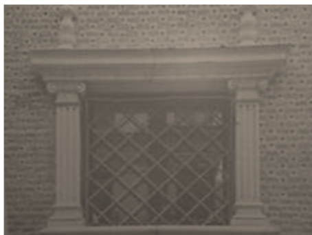
Figura 6. Anotaciones de los niños en la pizarra

En la pizarra digital, ya en el colegio, se proyecta (Figura 6) y los niños indican todos los descubrimientos.