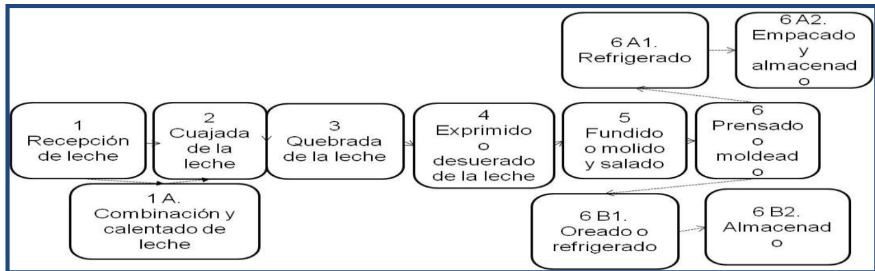
Figura 1. Diagrama del proceso productivo en procesamiento de lácteos

Fuente: Elaboración propia con base en la investigación