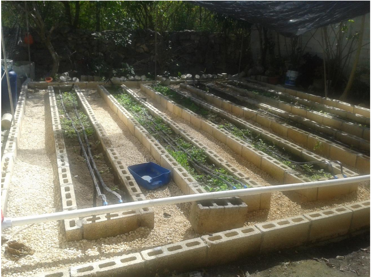
Figura 2. Huertos instalados en la comisaría de Tamanché por la Universidad Marista.