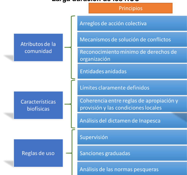
Figura 2. Esquema general del Marco AID y los Principios Característicos de Instituciones de Larga duración de los RUC