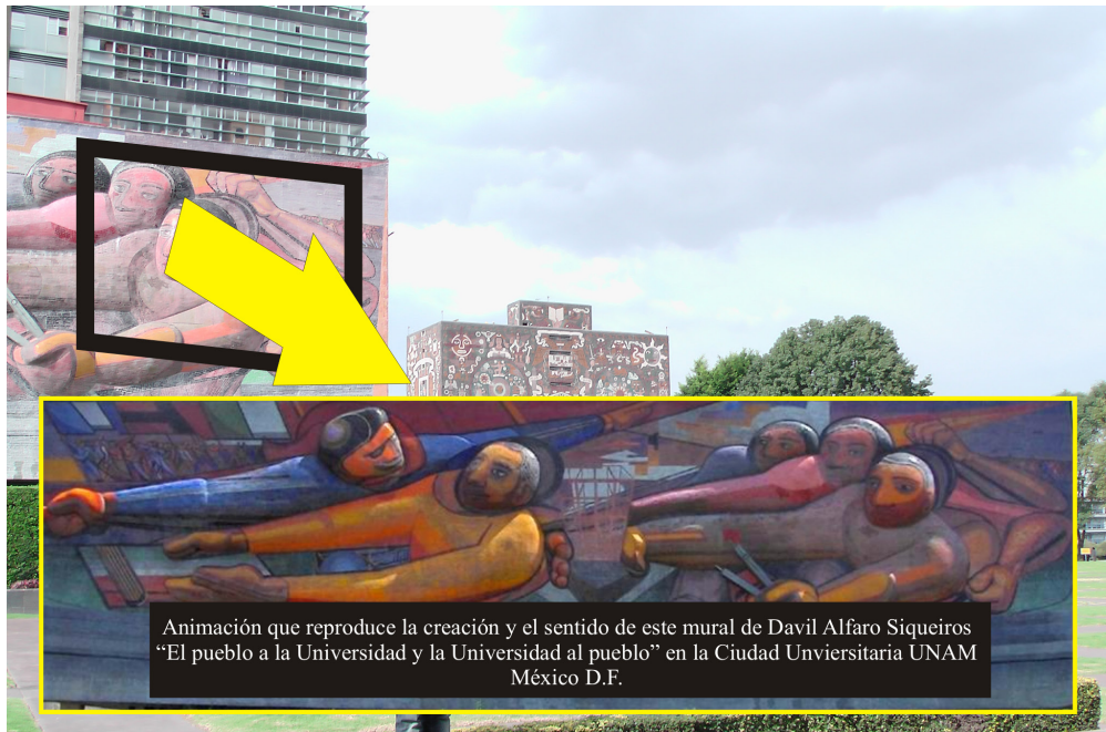
Imagen 2. Foto que al captar y reconocer determinado patrón provoca la visualización de una animación almacenada y superpuesta.

En ocasiones hay dispositivos específicos captura y visión que se integran en unas gafas especiales u otros dispositivos específicos y permiten al usuario ver la realidad a través de la lente y superponer y mostrar otra información gráfica. Esto suele utilizarse en empresas avanzadas de mantenimiento y reparación de maquinarias complejas que proporcionan estos aparatos especiales para combinar visión y las instrucciones correspondientes para que el operario realice la intervención con este apoyo. Estas aplicaciones pueden hacer que surja información de lugares específicos al ser captados con la cámara del dispositivo portátil del usuario, por ejemplo esta utilidad tiene actualmente desarrollos para museos o para textos ilustrados que son capaces de superponer otra información del tipo de texto, audio o de video (Perales y Adem, 2013).