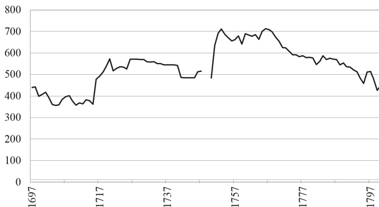
Figuur 1 Opbrengst van het gemene landsmiddel op wijn in Holland, 1697-1800 (guldens).

betering van 25 procent voor 1751-1760. 43 Men kan dus wel aannemen dat in de jaren voorafgaand aan de hervormingen minstens een vijfde van alle wijn werd verkocht zonder dat hier imposten over werden afgedragen.