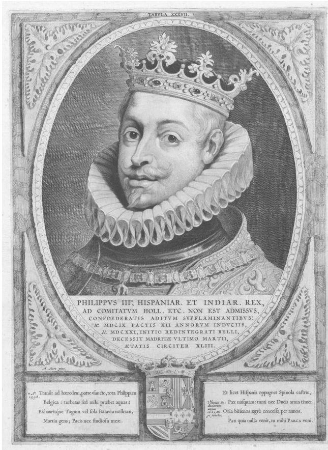
Illustratie 2: Portret van Filips III, Cornelis Visscher (II), naar een schilderij van Anthonis Mor, Haarlem, 1650. Collectie Rijksmuseum, RP-P-OB-62.212.

in heurlieder eygene schepe[n], met pasporten, als dat sij zijn en[de] comen van vrije steden, oft met Hoochduytsche Schippers'. 34 Filips spoorde de onderkoning daarom aan beter zijn best te doen, en hield hem als beloning één derde van de opbrengsten voor.