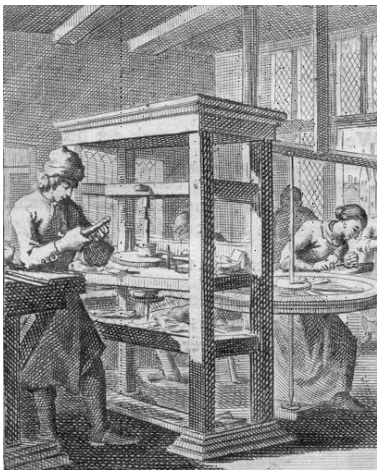
Jan en Caspar Luyken, 'De diamantslijper', achttiende eeuw (collectie auteur), voor het eerst gepubliceerd in Het menselyk bedryf (Amsterdam 1694). Rechts de diamantmolendraaister die de schijf van de diamantslijper aandrijft.

Dat vrouwen al in de zeventiende eeuw in de diamantslijperijen van Amsterdam werkzaam waren, is op de veel gereproduceerde afbeelding van 'De diamantslijper' uit Het menselyk bedryf van Jan en Casper Luyken al sinds 1694 te zien geweest. 35