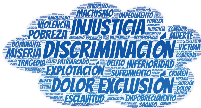
Figura 4. Nube de palabras de connotación negativa de Nela Martínez Espinosa.

Una mujer fuerte y decidida, que también tenía su lado sensible y humano, que demostró más aún cuando se convirtió en madre; asociaba a la maternidad con la ternura, por eso es que el término también aparece de manera contundente en el gráfico: a pesar de desear con fuerza la participación de la mujer en el sector público de la sociedad, la maternidad era algo sagrado que solo la mujer podía sentir al tener un hijo.