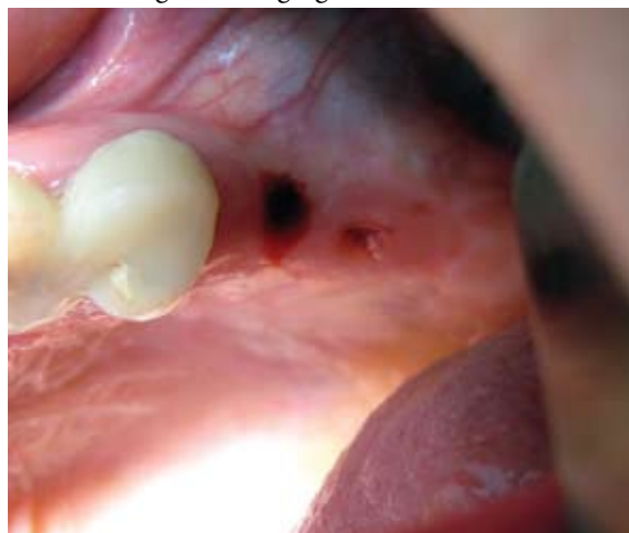
Fig.2. Aspectul miniplăgilor gingivale apărute în urma instalării transgingivale a implantelor la nivelul d.2.5.,2.6.

la 3 persoane INR-ul a fost de la 1.3 până la 1.6, fiind sub limitele diapazonului terapeutic (<2.0) recomandat de către medicul curant de profil general. Constatarea acestui fapt a sugerat prezența unui eventual risc de apariție a evenimentelor tromboembolice și, prin urmare, a servit drept indicație pentru majorarea dozei anticoagulantului sub controlul în dinamică al INR-lui. La un pacient valorile INR-lui au fost 2.1, adică în limitele diapazonului terapeutic (2.0-4.0) și, prin urmare, intervenția chirurgicală a fost efectuată fără a modifica doza medicației. În acest caz clinic, s-a efectuat elevația planșeului sinusului maxilar cu instalarea simultană a 2 implante dentare prin acces crestal fără decolarea lambourilor mucoperiostale și fără utilizarea materialelor osteoplaste (Figura 2). Imediat după finisarea intervenției s-a pus în evidență formarea cheagului de sânge (Figura 2), care, ulterior, facilitează regenerarea gingiei.