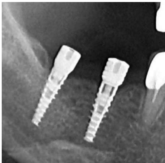
Fig.1. Instalarea implantelor dentare la nivelul d.4.6.,4.7 cu conectarea imediată a conformatoarelor gingivale

În celelalte cazuri, a doua etapă chirurgicală a fost efectuată (la mandibulă peste 3-4 luni, la maxilă peste 4-6) în mod standard: decolarea lambourilor mucoperiostale cu punerea în evidență a platformei implantului, înlăturarea șurubului de acoperire și instalarea conformatorului gingival.