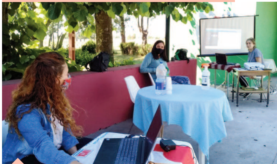
Curso sobre Herramientas de comercialización virtual de INTA Benito Juárez. Desafíos pos pandemia: hacer dialogar las nuevas prácticas digitales con las formas tradicionales de vinculación entre actores y actrices del territorio.

implementadas por las experiencias de comercialización que se acompañan desde las distintas unidades de INTA Balcarce. Las tramas de relaciones consolidadas en la mayoría de los casos se sostuvieron a partir de la utilización de diferentes medios y dispositivos digitales. Por ejemplo, el WhatsApp contuvo la organización y garantizó la participación y la toma de decisiones. Además, potenció la difusión para mantener las ventas.