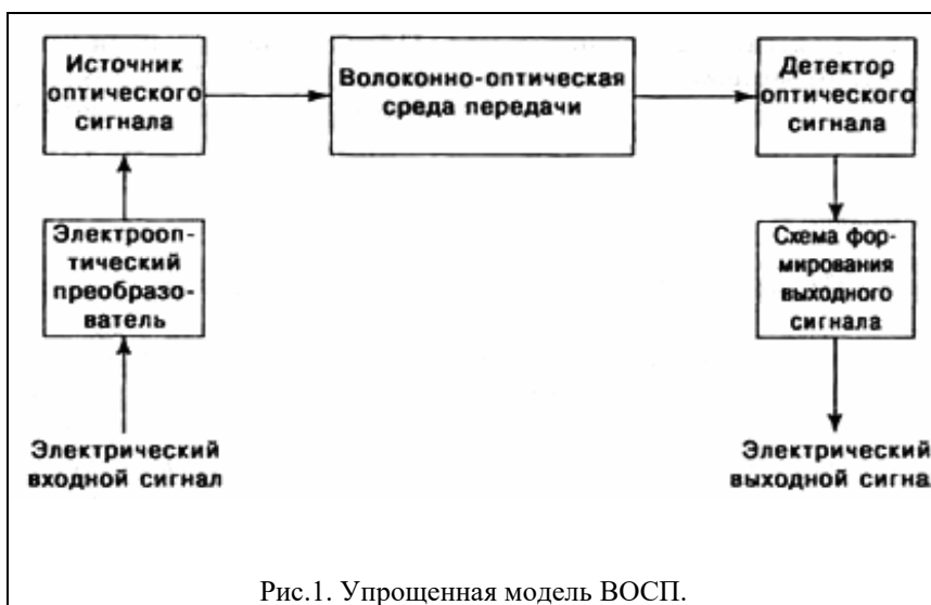
Рис.1. Упрощенная модель ВОСП.

Одномодовое волокно со смещённой дисперсией (англ. DSF – Dispersion Shifted Single Mode Fiber), определяется рекомендацией ITU–T G.653. В волокнах DSF с помощью примесей