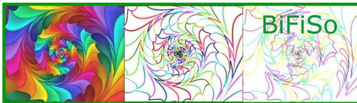
Logo del proyecto multidisciplinar del CSIC BiFiSo.

Contratada predoctoral CSIC. Game studies & Women's studies., Instituto de Filosofía (IFS-CSIC)