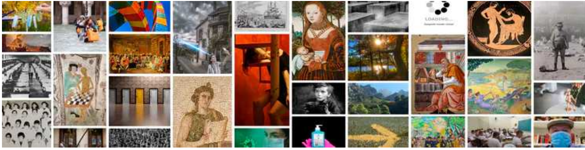
Carátula del Diccionario Filosófico audiovisual COVID-19 del IFS-CSIC.