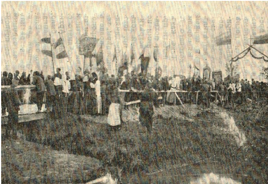
Додаток 3. Берестецький хресний хід на козацькі могили

[15]. Праця містить розлогий матеріал, що в деталях інформував про процес проведення дійства. Автори розписують хресні ходи до козацьким могилам: Перший Почаївський хресний хід, Радзивилівський хресний хід, Почаївський