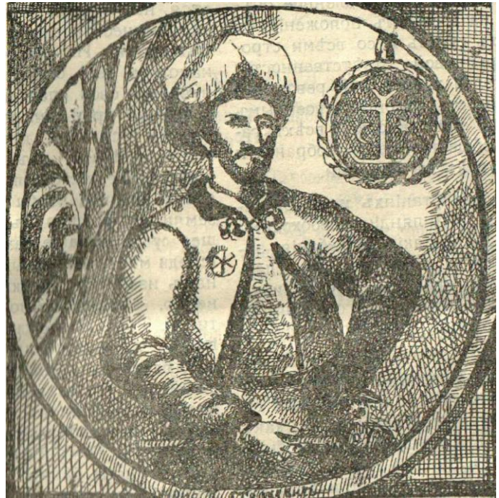
Лолаток 2. Гетьман Іван Мазепа

Більш поверховий огляд здійснювався журналістами при аналізі інших бойових сутичок війни VII ст. Так в одній із статей «Типы деятелей православия на Волыни. Казачество и Богдан Хмельницкий» [3] автор побіжно характеризує перебіг боїв під Жовтими водами (19 квітня – 6 травня 1648 р.), під Корсунем (15 – 16 травня 1648 р.), під Зборовим (серпень 1649 р.), під Берестечком (18 червня – 30 червня 1651 р.) та знову ж таки відзначає відвагу і військову силу козацького війська: «Казачество имело... такую военную силу которой лишены были все другие сословия» [3]. Що ж до, висвітленні волинськими журналістами Полтавської битви, то знайдено таке: «Порядок празднования Полтавской битвы. Фото братской